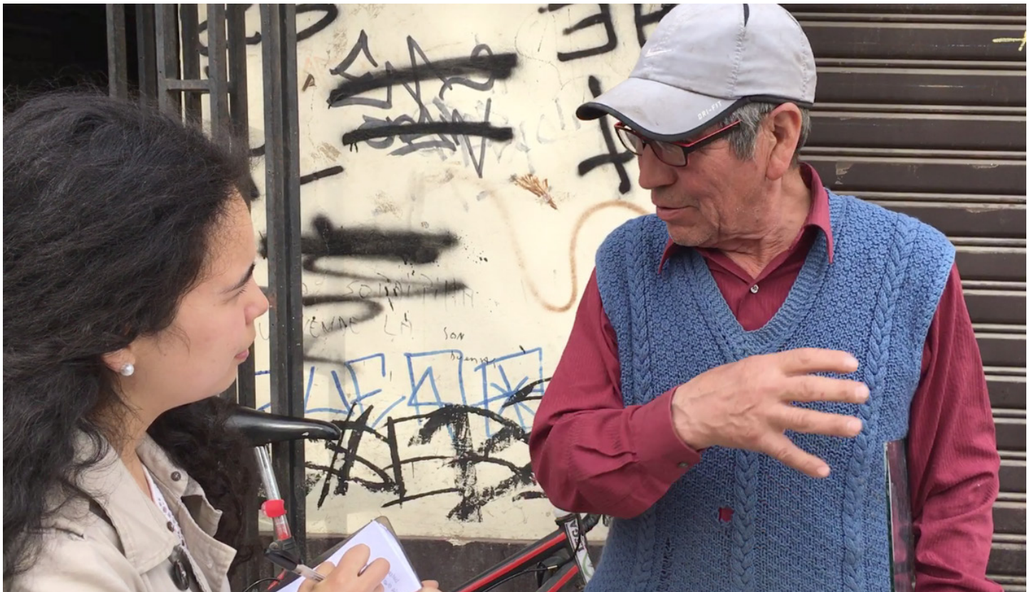
Figura 9. Entrevista flash vecinos

Además, en un principio considerábamos una muestra de adultos porque teníamos la percepción de que eran los que más participaban de las actividades comunitarias. Luego de las entrevistas notamos que los adultos mayores también formaban parte de estas actividades y eran beneficiados con proyectos de la Municipalidad.