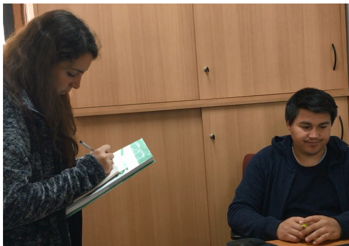
Figura 3. Entrevista DIDECO.

A continuación se presenta el desarrollo de estas metodologías en terreno.