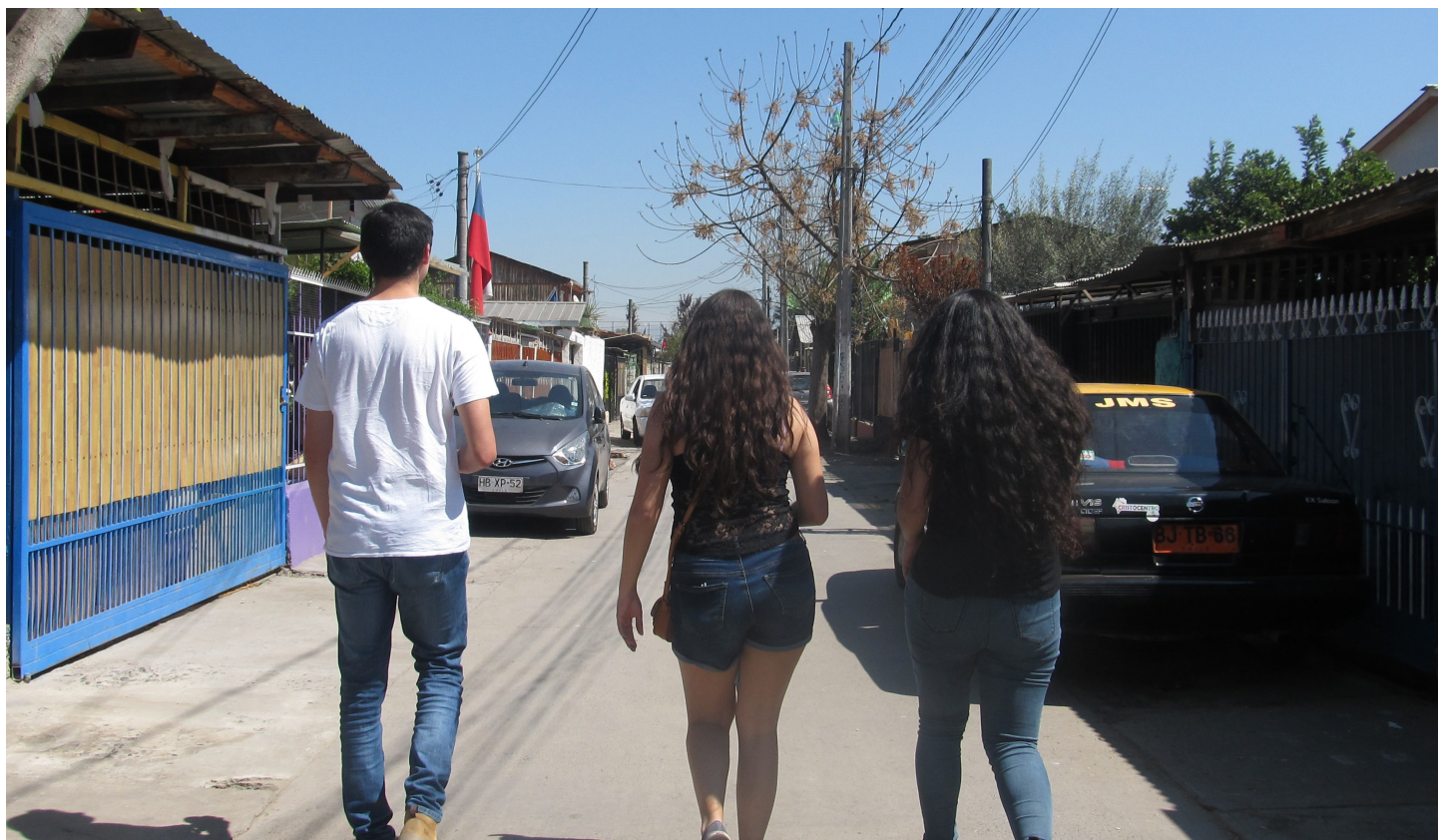
Figura 2. Observación no participante.