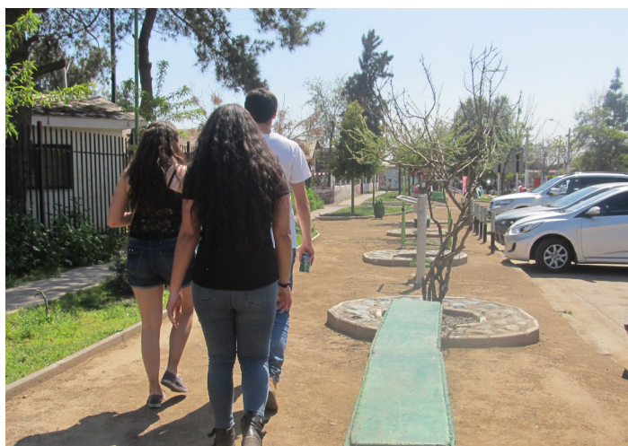
Figura 10. Observación no participante.

Consideramos relevante explicar la utilización de estas herramientas, porque son parte fundamental de los métodos mencionados con antelación, pero a su vez, conforman una metodología por si solos. Gracias a estos métodos, se obtuvieron detalles específicos de las situaciones que estábamos analizando.