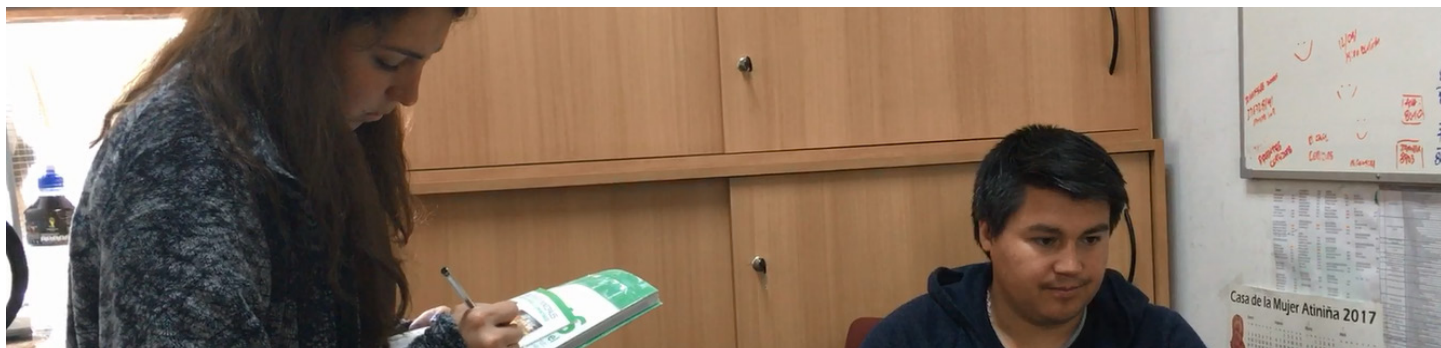
Figura 13. Anotaciones entrevista DIDECO .