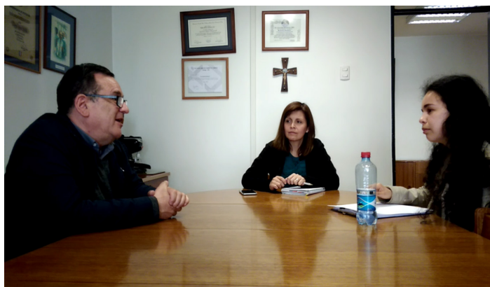
Figura 4. Entrevista administradores Santuario Cristo Flagelado.

Gracias a esta entrevista nos hemos informado de las diversas actividades que se realizan en él y el sentido de ellas para la comunidad. También, que este espacio, junto a la Sala Pastoral (al costado de esta) eran utilizados por ellos en las liturgias diarias, por colegios aledaños y parte de la parroquia San Luis Beltrán. Ahora bien, también podía ser solicitado por cualquier