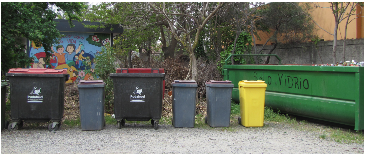
Figura 12. Contenedores de vidrio.

Mediante esta experiencia logramos hacer una delimitación primaria del terreno que efectivamente podíamos abarcar en nuestra investigación. Nos dimos cuenta de los cercano que está COANIQUEM de las comunas colindantes. Por esto, enfatizamos las calles que serían nuestra frontera, para así no cambiar de comuna. También, debido al grito de advertencia de este caballero, nos dimos cuenta que creamos un sesgo de que el lugar es peligroso.