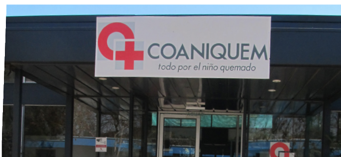
Figura 1. Fachada COANIQUEM.

Cómo mejorar la relación de COANIQUEM con el vecindario de Pudahuel