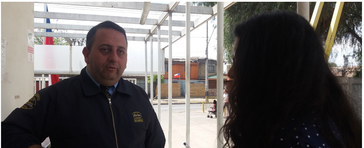
Figura 5. Entrevista a portero.

En esta entrevista se cumplieron los 2 primeros objetivos, ya que conocemos el número estimado de personas que entran al recinto diariamente y los motivos principales de las visitas. Pero el tercer objetivo no se cumplió ya que no se pudo desprender ningún patrón entre los grupos identificados. ¿Por qué vienen a COANIQUEM y no a otro lugar? ¿Qué clase de proveedores son? ¿Cuáles son las temáticas de las investigaciones? Son preguntas que surgieron y no fué posible responder con la información obtenida.