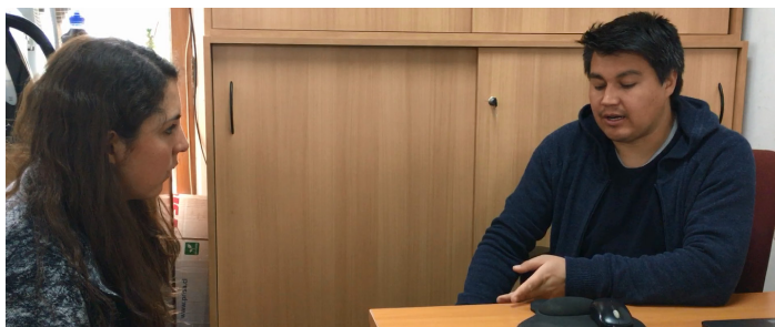
Figura 7. Entrevista encargado de DIDECO.