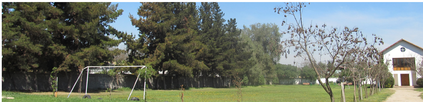
Figura 6. Cancha de fútbol COANIQUEM.