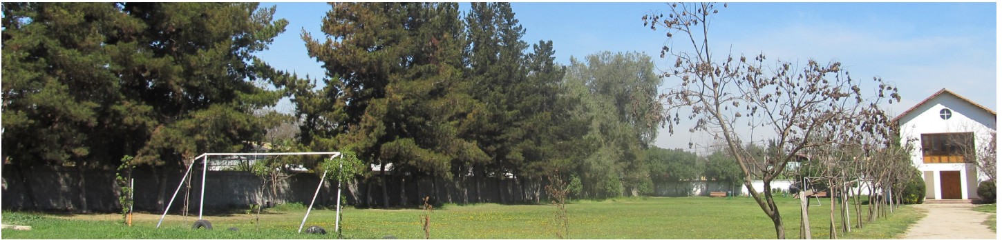
Figura 11. Cancha de fútbol COANIQUEM.