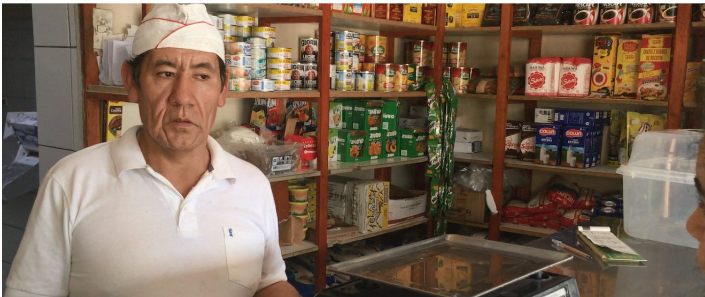
Figura 8. Entrevista flash al dueño de panadería.

El objetivo de las entrevistas flash era indagar la percepción de COANIQUEM que tienen los vecinos y tantee el interés entorno a las actividades comunitarias.