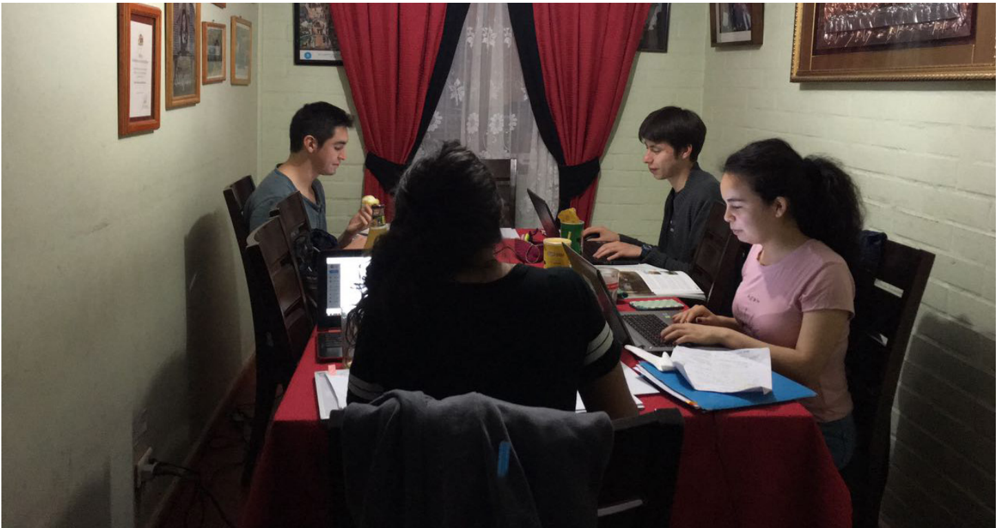
Figura 14. Trabajo grupal.